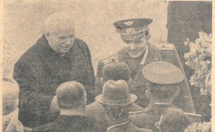
Москва, 14 апреля 1961 года. Торжественная встреча на Внуковском аэродроме славного сына советского народа героя-космонавта Юрия Алексеевича Гагарина.