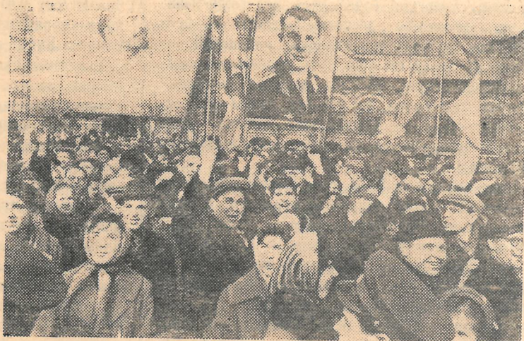
Москва, 14 апреля 1961 года. Митинг трудящихся города Москвы на Красной площади, посвященный великой всемирно-исторической победе советского народа — успешному осуществлению первого в мире космического полета нашего дорогого соотечественника Ю. А. Гагарина.