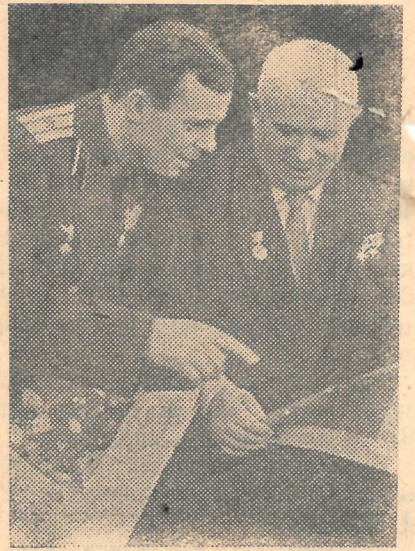
Н. С. Хрущев беседует с первым в истории космонавтом Ю. А. Гагариным на приеме в Большом Кремлевском дворце 14 апреля 1961 года.